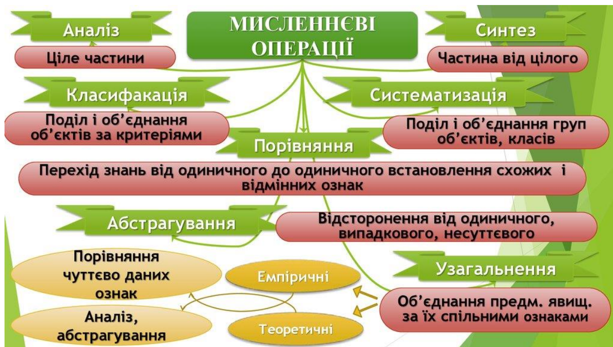
Рис.1. Структура мисленнєвої операції

Формуванню елементів мислення та навичок мисленнєвої діяльності при розв'язуванні задач допомагають вправи творчого характеру: розв'язування задач підвищеної складності, розв'язування завдань кількома способами, розв'язування задач з відсутніми чи зайвими даними, розв'язування задач, що мають кілька розв'язків, а також вправи на складання і перетворення задач.